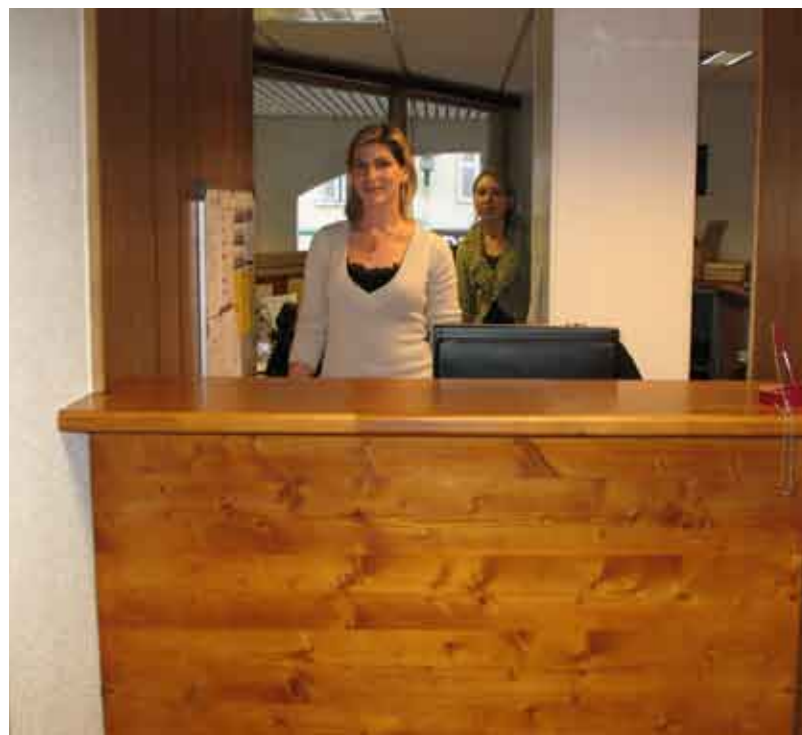
Création d'une banque d'accueil

E n attendant ce déménagement, la Communauté de Communes a procédé à quelques travaux d'amélioration de ses locaux cet été.