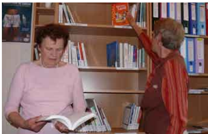
Consultation sur place des ouvrages sur le « Bien vieillir »

*La consultation et le prêt sont gratuits. Pour s'inscrire, se munir d'une pièce d'identité et d'un justificatif de domicile.