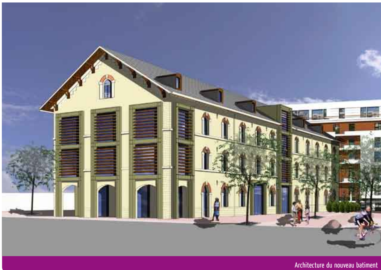
Architecture du nouveau bâtiment

la ville de Rumilly. Le contrat de réservation des futurs locaux a été approuvé en Conseil communautaire du 8 octobre 2007 et vise à l'acquisition foncière de ces nouveaux bureaux.