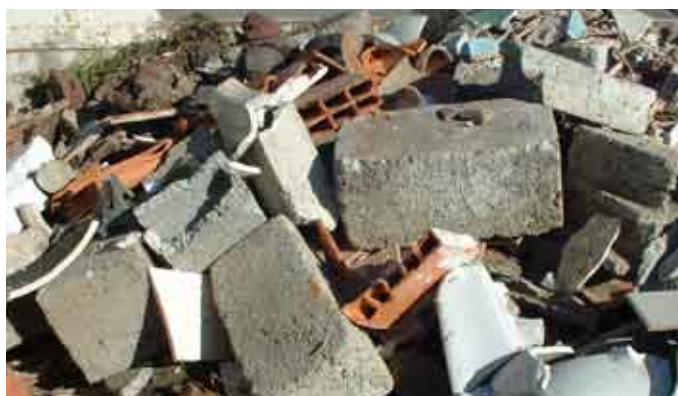
Stockage des gravats de chantier

d'accueil nécessaire à ce type de déchets, en fonction des besoins existants sur le canton et les sites potentiels d'exploitation. Un autre aspect de l'étude définira les conditions techniques, réglementaires et financières de réalisation et de fonctionnement de cet éventuel centre de stockage et d'exploitation de déchets inertes. Les résultats de l'étude sont attendus pour début 2008.