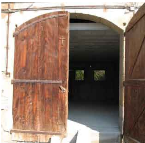
Grange en rénovation

Un des objectifs visé par la Communauté de Communes du Canton de Rumilly lors du lancement de l'Opération Programmée d'Amélioration de l'Habitat (OPAH) fin 2003, consiste à favoriser le maintien à domicile des personnes âgées, dans de bonnes conditions, en leur permettant d'adapter leurs logements à leurs besoins.