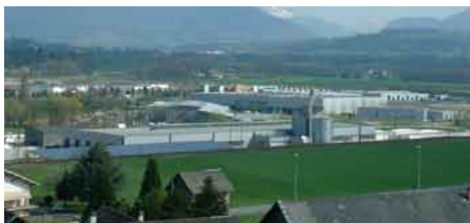
Zone d'activités économiques

L'acquisition des terrains par la Communauté de Communes permettra ensuite de lancer la phase opération des travaux d'aménagement, en premier lieu, sur la zone du « Petit Martenex ».