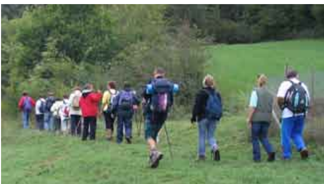
Randonneurs en Albanais

Ce balisage matérialise les sentiers PDIPR et contribue à offrir des conditions favorables à la randonnée en termes de sécurisation et de repérage des circuits. Situé à proximité des départs du sentier, un panneau d'accueil informe le randonneur sur le site et sur l'accessibilité des itinéraires. Le balisage renseigne sur la direction à suivre tout au long du parcours et indique les temps de marche, le lieu, l'altitude... Le promeneur se laisse ainsi guider en toute autonomie et en toute quiétude à la