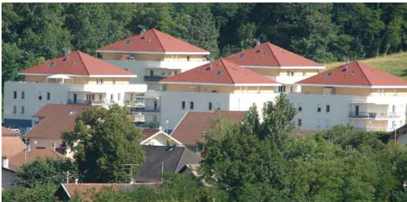
Habitat collectif neuf

C'est à partir de ces axes que sont définies les actions habitat du PLH.