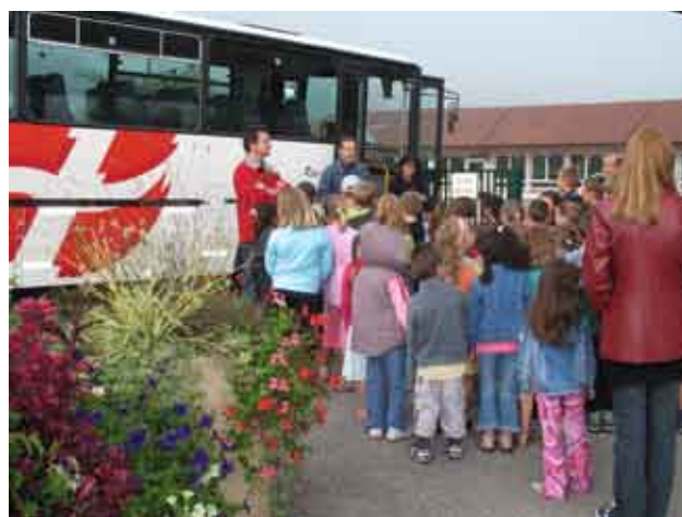
Les élèves de Lornay en exercice d'évacuation de cars

Ces sessions sont mises en place dans le cadre préventif des sorties scolaires et extrascolaires effectuées en bus par les instituteurs.